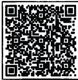
QR Code ฐานข้อมูลและแบบรายงานฯ สำหรับศูนย์เรียนรู้โคก หนอง นา (จบเงินกู้)

๑.๓ เจ้าหน้าที่พัฒนาชุมชนอำเภอรายงานผลการทบทวนขึ้นทะเบียนศูนย์เรียนรู้ ในแบบรายงานตามที่กรมการพัฒนาชุมชนกำหนด ทั้งนี้ หากเจ้าของพื้นที่ศูนย์เรียนรู้ ไม่มีความประสงค์ขึ้นทะเบียนกับกรมการพัฒนาชุมชน ขอให้เจ้าหน้าที่ที่รับผิดชอบบันทึกเหตุผลการไม่ขึ้นทะเบียนฯ ของเจ้าของพื้นที่ศูนย์เรียนรู้ ในแบบรายงานด้วย เพื่อเป็นข้อมูลในการพัฒนางานศูนย์เรียนรู้ ต่อไป